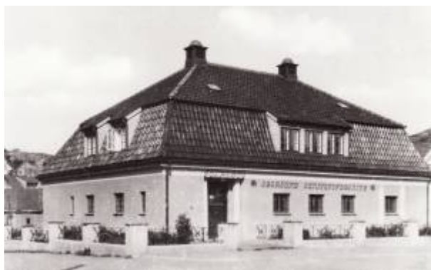
Folkebadet ca 1930.

I mellomkrigstiden kom folkehelsen for alvor på dagsorden i landet, og både offentlige myndigheter og frivillige organisasjoner grep fatt i problemstillinger knyttet til boforhold, kosthold og hygiene.