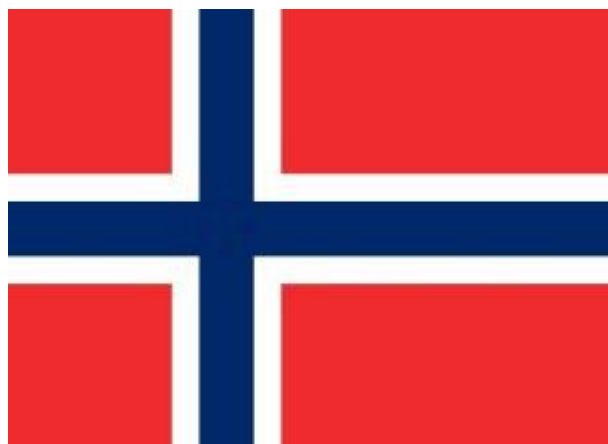
Norges flagg - «Det rene flagg»

Etterdønningene av 17. mai-feiringen 1894 raste lenge i byens to aviser, og frontene var steile. I oktober kom meldingen om at regjeringen hadde nektet å godkjenne bystyrevedtakene som lå til grunn for flaggstriden i byen, og saken måtte nok en gang til behandling. 8. mai 1895 vedtok formannskapet å heise det rene flagget på kommunens flaggstang i parken. Flere finurlige knep ble brukt av begge parter for å vinne fram med sin sak, men ingen av dem førte fram til målet. Det endte med at når folk samlet seg om morgenen for å starte feiringen av dagen sto flaggstangen tom.