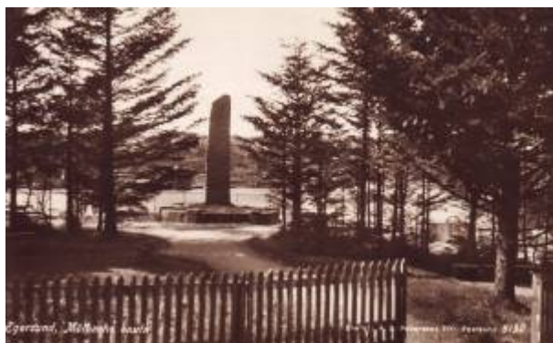
Fjellparken ca. 1920.

Fjellparken ligger ved Varbergveien, sør for Solkrone . Parken er et resultat av at Egersund Skog- og Treplantningsselskaps sterke engasjement i utbedring og opparbeiding av Varbergveien til Ryttervik.