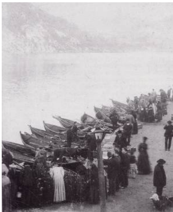
Dagens tilbud av fersk fisk bys fram.

Området mellom Torget og Vågen og bryggeområdet nordvest for kirken . Brygga var utbygd før 1858, muligens som en privat brygge. Den ble navngitt i 1905.