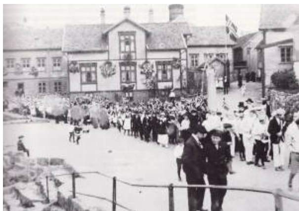
17-maitog på Fabrikkplassen i 1914.

Plassen mellom Gamleveien og Fabrikkgaten , langs Lundeåne . Den var regulert som veg langs Lundeåne i Reguleringsplan 1858 og kalt Gade No.27. Fra plassen gikk det ei trapp, Tråme , ned til en vaskeplass i elva.