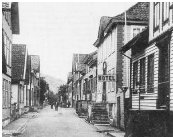
Ellingsens Hotel, 1897.