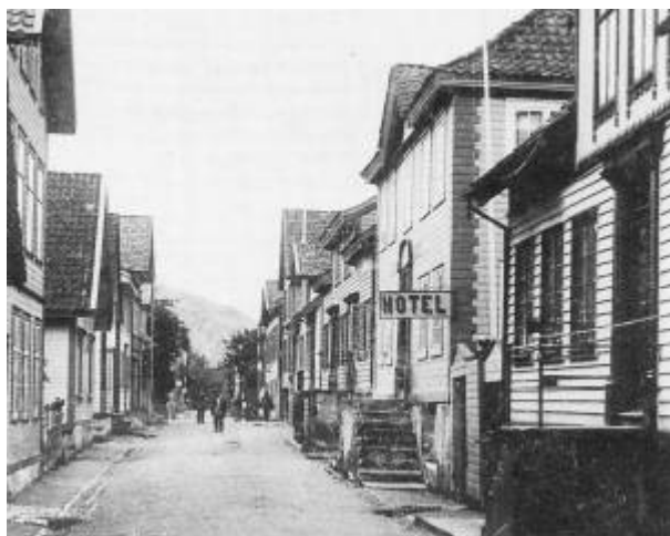
Ellingsens Hotel, 1897.