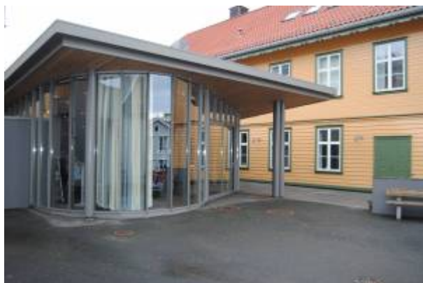
Eigersund kulturskole, 2012.

Den 6. november 1975 startet Eigersund kommunale musikk-skole opp med undervisning. De første årene holdt skolen til i lokaler rundt om på forskjellige skoler, og det ble undervist i ulike instrumenter. Etter hvert ble tilbudet utvidet til å gjelde bl.a. dans, drama, musikk og sang. Skolen skiftet derfor navn til Eigersund musikk- og kulturskole i 1997 og senere, i 2003, til Eigersund kulturskole . Våren 2003 flyttet skolen inn i lokalene til den tidligere folkeskolen , som hadde blitt ombygget og spesialtilpasset kulturskolens behov. Skolen drives av Eigersund kommune, men finansieres delvis med elevavgifter. For tiden 1) får rundt 550 elever undervisning gjennom kulturskolen. 2)