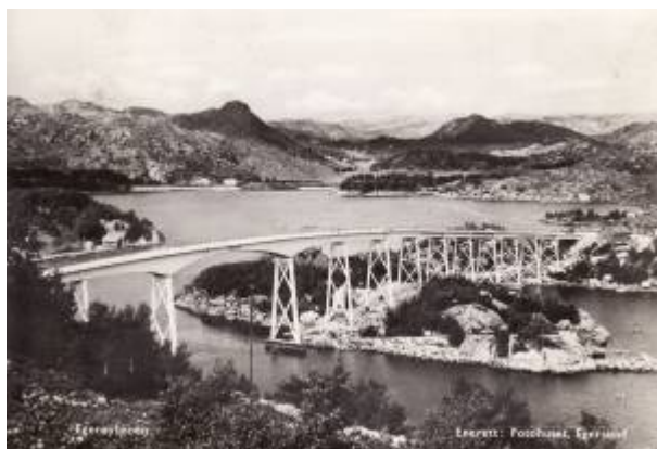
Eigerøy bru i 1951.

Eigerøy bru, som forbinder Eigerøy med fastlandet, ble åpnet 20. august 1951 av kronprins Olav.