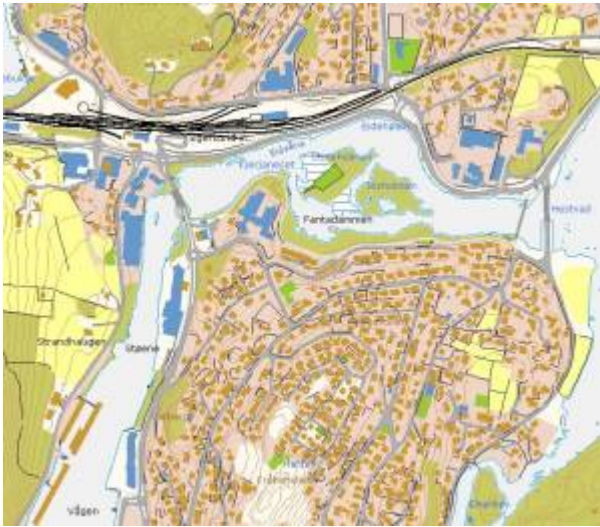
Kart: Eigersund kommunes kartløsning

Eieåne (off.: Eideåna ) utgjør sammen med Lundeåne den nedre del av Hellelandsvassdraget, et vassdrag som har et nedslagsfelt på 243,3 km 2 og en høydeforskjell på 0 til 906 m.o.h. Elva (åne) har navnet sitt etter gårdsnavnet Eie (Eide). Lengden er rundt 1,2 km.