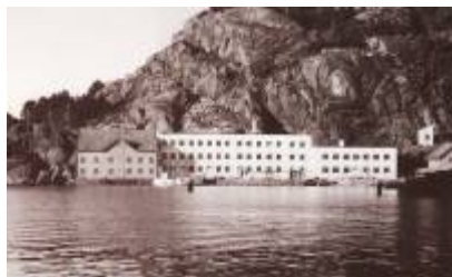
Den gjenoppbygde Eie Stentøifabrick etter brannen i 1938.

Deretter var det stabil drift fram til 1938, da bedriften igjen ble rammet av brann. Etter denne brannen ble fabrikken gjenreist i helt ny skikkelse og kunne i 1939 starte produksjon i en helt ny og moderne, funksjonalistisk fabrikkbygning. Nytt, moderne maskineri var også anskaffet, slik at bedriften sto godt rustet til den nye hverdagen etter andre verdenskrigs slutt.