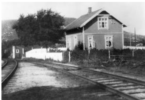
Eie pens og banevokterhuset, ca 1925. Sporet til venstre fører til Egersund, sporet til høyre fører til Flekkefjord.

Da Flekkefjordbanen åpnet i 1904 tok den av fra Jærbanen på Eie, ved Eie pens 1) . Det var ingen stasjon på Eie på det tidspunkt, og ordningen var at toget fra Stavanger til Flekkefjord kjørte ned til Jernbanestasjonen i sentrum , hadde stopp der, rygget tilbake til Eie og fortsatte til Flekkefjord. Tilsvarende prosedyre gjaldt for tog i den andre retningen. Pensen ble betjent av en banevokter som bodde ved linja. Eie pens var i funksjon til Sørlandsbanen ble åpnet og stasjonen flyttet til Eie i 1944.