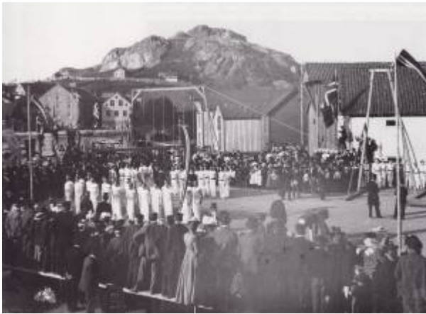
Turnstevne i Lervika 1900.

Turnforeningen ble stiftet 21. september 1891, med utspring i den kristelige Egersunds Ynglingeforening. Allerede to uker etter stiftelsen begynte foreningen med turnøvelser i Gymnastikklokalet som kommunen hadde stilt til gratis disposisjon. Bare menn deltok, og treningen gikk bra. Ved årsskiftet ble den første turnoppvisningen holdt for fullsatt lokale. I september 1892 ble det gjort et forsøk på å opprette et dameparti, men interessen var ikke stor nok til at det lyktes. I oktober 1893 ble det gjort formelt vedtak på en ekstraordinær generalforsamling at damer skulle kunne opptas som aktive medlemmer. Det tok imidlertid rundt 30 år før et dameparti ble permanent etablert.