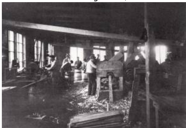
Tønneproduksjon 1917.