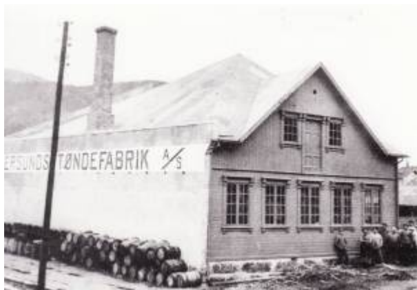
Tønnefabrikken i Møllegaten 9, 1917.