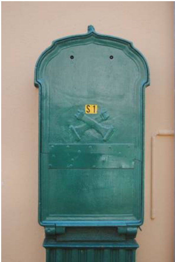
Koblingsskap for Egersunds Telefonselskab.

Byens første telefonlinje ble satt opp mellom jernbanestasjonen og Dampskipskaien i slutten av mai 1887 av tre unge teknologiforkjempere. De to viktigste kommunikasjonspunkter i byen hadde dermed fått et godt hjelpemiddel for å samordne korrespondansen mellom båt og tog.