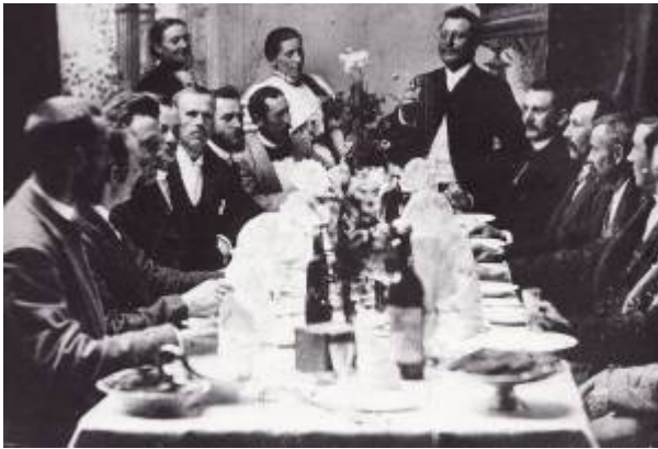
Egersunds Mandssangforening i lystig lag.

Egersunds Mandssangforening ble stiftet 17. mai 1901 under et svært så lystig lag på Ellingsens Hotel . Et «stort herrekor» som tidligere på dagen hadde holdt konsert i Parken og framført nasjonale sanger, feiret seg selv med en patriotisk fest.