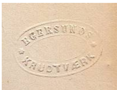
Egersunds Krudtværks stempel.

I 1854 ble Egersunds Krudtmølles 1) Interessentskap dannet for å bygge et kruttverk ved Egersund. Tanken var primært å produsere minérkrutt – svartkrutt – til bergverksindustrien, men også kanon-, jakt- og riflekrutt. Tomt til formålet ble innkjøpt på Hadland i 1854, og bygging av fabrikken tok til under ledelse av verksmester Anchersen. Han hadde tidligere arbeidet på Alvøens Krudtværk, som hadde blitt rammet av en eksplosjon i 1852.