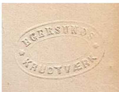
Egersunds Krudtværks stempel.

I 1854 ble Egersunds Krudtmølles 1) Interessentskap dannet for å bygge et kruttverk ved Egersund. Tanken var primært å produsere minérkrutt – svartkrutt – til bergverksindustrien, men også kanon-, jakt- og riflekrutt. Tomt til formålet ble innkjøpt på Hadland i 1854, og bygging av fabrikken tok til under ledelse av verksmester Anchersen. Han hadde tidligere arbeidet på Alvøens Krudtværk, som hadde blitt rammet av en eksplosjon i 1852.