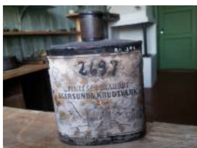
Emballasje for Fiint Geværkrutt fra Egersunds Krudtværk.