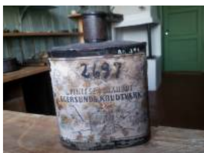
Emballasje for Fiint Geværkrutt fra Egersunds Krudtværk.