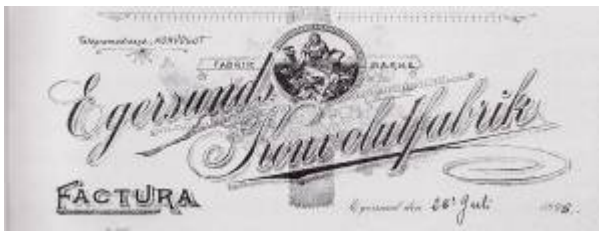
Konvolutfabrikens brevhode.

A/S Egersunds Konvolutfabrik startet opp sin virksomhet våren 1898 i leide lokaler hos snekker Olaus Hegdal i Peder Clausens gate 20 . Fabrikken hadde to maskiner som ble drevet med vannkraft. Den ene kuttet papiret til konvoluttene, den andre laget dem ferdige. Kapasiteten var 35 000 konvolutter om dagen, og de kunne produseres i tre størrelser. Selv om fabrikken visstnok var den eneste i sitt slag i landet når den startet opp, kapasiteten var god og kvaliteten var på høyde med det beste fra utlandet klarte den ikke å hevde seg i markedet, og etter bare to års drift var det hele over. Konkurransen fra en ny og større fabrikk i Tønsberg ble sagt å ha skylda. 1)