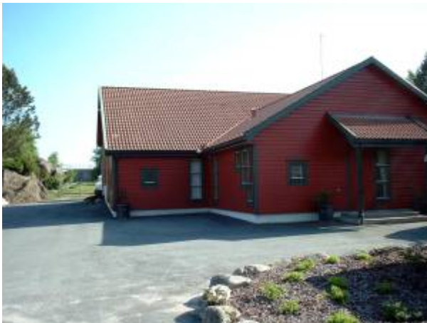
Vannbehandlingsanlegget ved Kråkevatn.

Etter en lengre utrednings- og planleggingsfase ble det i 1992 satt i gang arbeid med nytt vannbehandlingsanlegg og ny overføringsledning fra Kråkevatn til Tveidatjødne. Vannbehandlingen skulle nå bestå av siling, alkalisering gjennom åpent marmorfilter og desinfeksjon ved UV-bestråling. Den nye overføringsledningen skulle være av støpejern, og kobles til den eksisterende inntaksledningen ved Tveidatjødne.