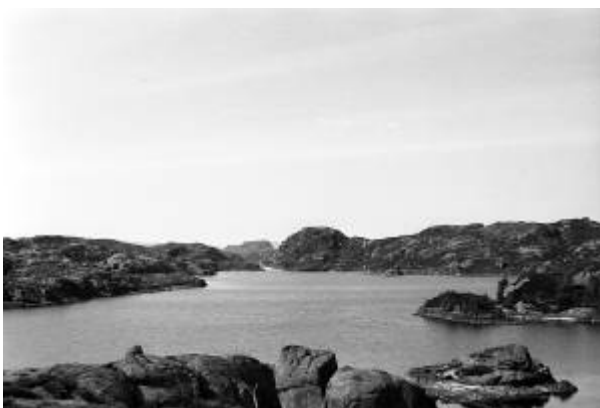
Kråkevatn i 1941.

Den tyske invasjonen i 1940 førte blant mye annet også til at vannforbruket fikk en brå økning. Det førte til at formannskapet 15. juli 1940 oppnevnte en vannverkskomité som skulle få fortgang i gjennomføringen av utvidelsesplanene. Formannskapet ba kort tid etterpå komitéen om å innhente