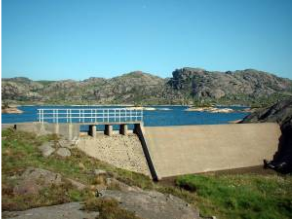
Holmavatn i dag.

anbud på Nordsjøprosjektet etter tidligere vedtatte planer. Det var komitéen ikke villig til, og henviste til de problemer som var påvist. I stedet utredet den på rekordtid planer for overføring av Kråkevatn. Planen ble vedtatt av bystyret 22. august, og nødvendige tillatelser fra departementet forelå 17. september. To uker senere var anlegget påbegynt.