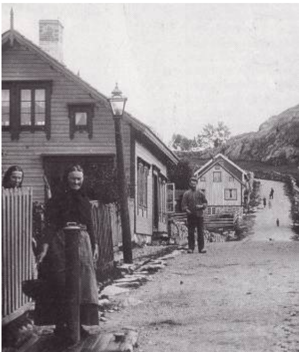
De som ikke hadde innlagt vann i huset kunne tappe i offentlige vannposter som her i Gamleveien. Foto: P. A. Flak/DF (Utsnitt)