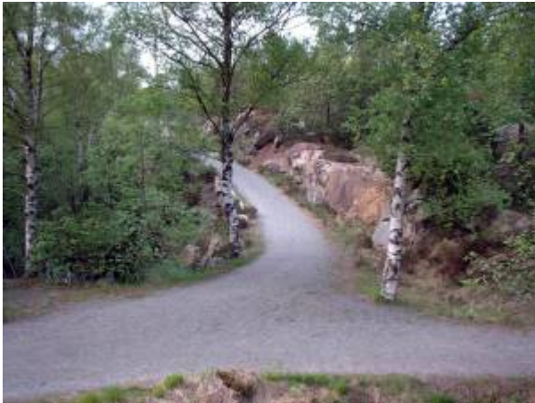
Damstedet som ikke lot seg bruke i Nordsjøprosjektet.

Før anleggsarbeidene skulle settes i gang ønsket formannskapet å befare de steder det skulle bygges dammer. På denne befaringen kom det fram at de beregninger som var gjort over Nordsjøens nedslagsfelt bare var overslag og ikke nøyaktige beregninger slik formannskap og bystyre hadde trodd. Det ble der og da vedtatt at intet anlegg måtte settes i gang før slike beregninger var utført. Det ble også bestemt at utbyggingsplanene skulle vurderes av ingeniører fra Stavanger.