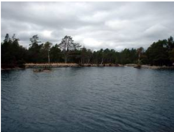
Sandtjødne i dag, sett mot nord.

Langes vurdering var at alt. 3 var det eneste som hadde tilfredsstillende og passende magasin og nedslagsfelt til å mølte framtiden med. Han mente også at det måtte bygges ny overføringsledning fra Inntaksbassenget til byen. I vannverkskomitéen reiste Th. Nordaas tvil om riktigheten av de kapasitetsberegninger som forelå for alt. 2, og komitéen endte opp med å foreslå gjennomføring av alt. 3 og innkjøp av grunn til alt. 2. Formannskapet var i sin tur enig i dette, og foreslo i tillegg at ny overføringsledning måtte bygges. Bystyret behandlet saken første gang 18. juni 1896. Det var stadig tvil om beregningenes pålitelighet, og saken ble utsatt og sendt tilbake til komitéen med ønske om at Lange eller ing. Zimmer, også han fra Stavanger, skulle gjennomgå planene på nytt. Det endte med at komitéen la fram et nytt alternativ: 2a. Oppdemming av Sandtjødne 1,5 m og Tveidatjødne 2 m og utdyping av dets utløp inntil 3 m, hvilket man mente skulle gi et totalt magasin på 176 000 m 3 vann til en kostnad på rundt kr. 6800.