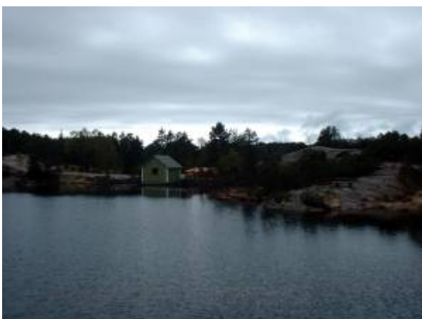
Inntakshuset i Kjerketjødne.

I 1959 ble inntaket flyttet fra inntaksbassenget til Kjerketjødne for å gi økt vanntrykk på nettet - det var store problemer med vannforsyningen på Husabø og på Havsøya . Ved den anledning ble både inntaksbassenget og Første vannbasseng frakoblet, men beholdt som reservemagasin.