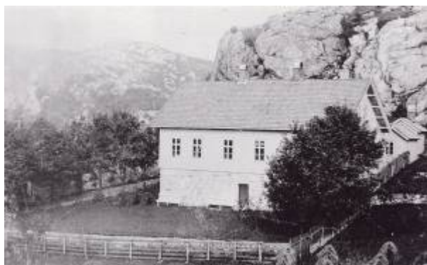
Egersund sykehus.

På slutten av 1870-åra kom det fart i planene om å bygge et sykehus for Egersund. Tomt til formålet ble kjøpt inn på Damsgård i januar 1879, og allerede sommeren 1880 sto sykehuset ferdig. Det hadde en kapasitet på 12 pasienter, og inneholdt også et offentlig bad. Sykehuset ble i det alt vesentlige finansiert av overskuddet fra Samlaget .