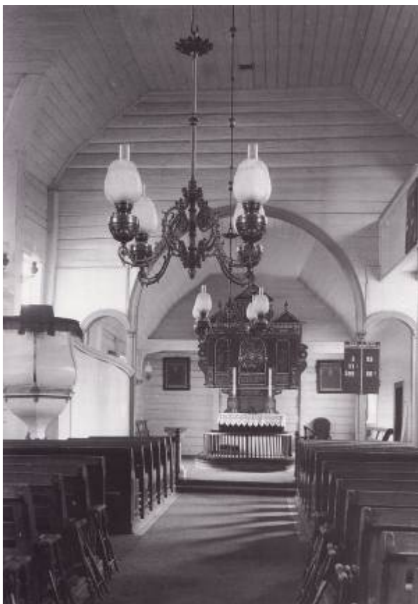
Interiør fra kirken før den siste innvendige restaurering.