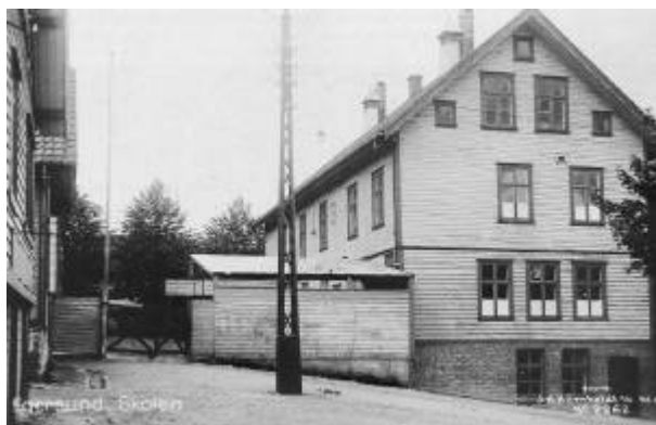
Vinteren 1918 var det folkekjøkkenet i Folkeskolebygningens kjeller.

Under 1. verdenskrig ble det etter hvert alvorlig mangel på mange viktige varer. Spesielt under den harde vinteren 1917-18 var det mange av byens innbyggere som ikke hadde råd til å spise seg mette hver dag. Det hjalp ikke å inneha provianteringsrådets rabattkort så lenge en ikke hadde penger til å betale egenandelen.