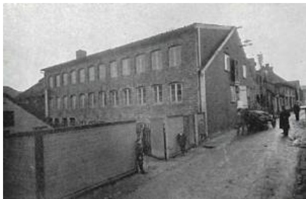
Eger Mølle 1917.