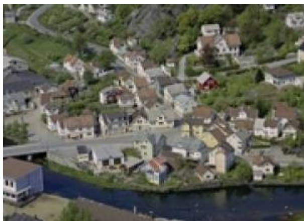
Damsgård, 1961.