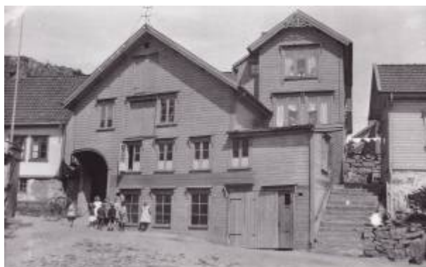
Bygningskomplekset til Damsgaard Potteri.