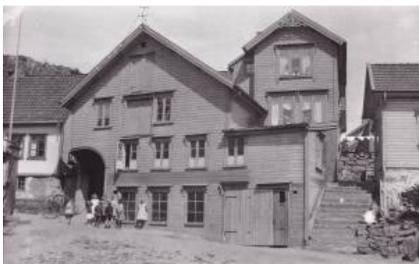
Bygningskomplekset til Damsgaard Potteri.