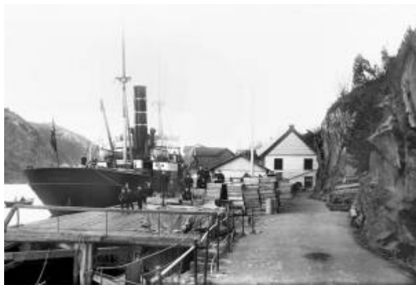
Dampskipskaien ca. 1906. Skipet Castor fra Bergen ligger til kai.

Da trafikken med dampskip tok seg opp langs kysten var havnene dårlig utrustet til å ta imot den økende trafikken. I kystrutas barndom var det vanlig at skipene ankret opp på reden og passasjerer og gods ble fraktet til og fra land i mindre båter. Brannfaren som de nye skipene representerte var også en medvirkende årsak til dette opplegget.