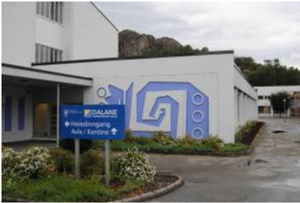
Dalane videregående skole, 2010.

Den 1. januar 1990 ble tre videregående skoler i Dalane, Eigersund videregående skole , Dalheim videregående skole og Dalane videregående skole, samlet til en skole under navnet Dalane videregående skole. Den nye skolen ble etablert på Lagård.