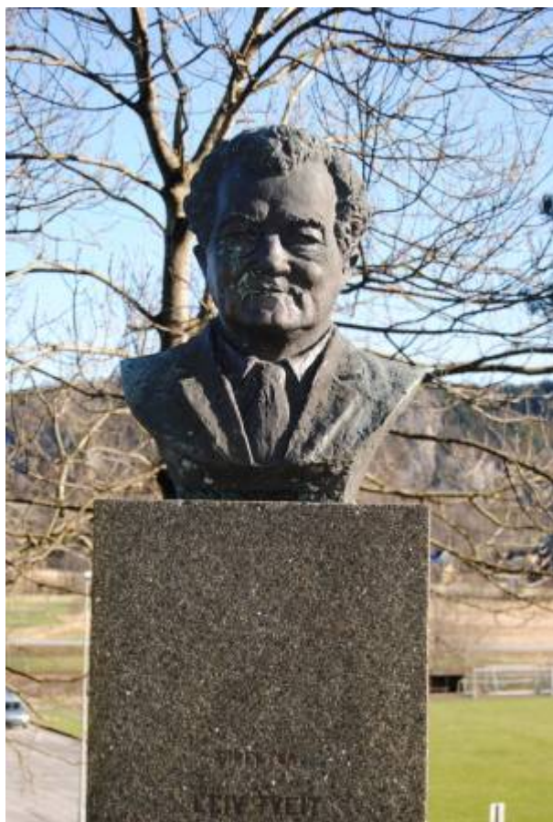
Byste av Leiv Tveit.

Byste av institusjonen Bakkebøs første bestyrer Leiv Tveit, plassert ved Bakkebø kirke . Bysten er utført av billedhugger Emma Matthiasen, og ble avduket av Bakkebøs mangeårige sjåfør, Jens Tønnessen, 26. oktober 1970. 1)