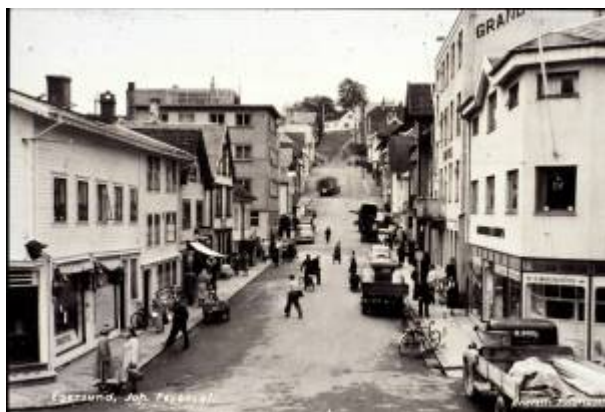
Johan Feyers gate i 1950-åra.