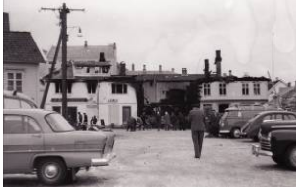
Brannens herjinger inspiseres.

Bybrannen i 1961 er en av seks kjente Bybranner i Egersund.