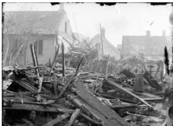
Storgaten 12 sett fra sør etter brannen i 1896.

Bybrannen i 1896 er en av seks kjente Bybranner i Egersund.