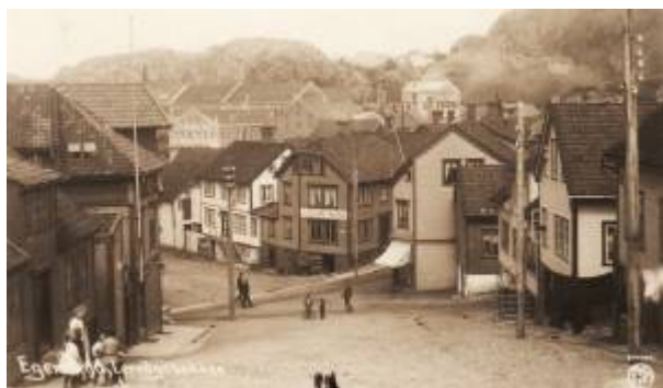
Lerviksbakken er en av tre branngater.

En branngate er en bred gate anlagt for å hindre spredning av brann i en ellers tett trehusbebyggelse. I Egersund er det regulert tre gater med funksjon som branngate: Skriveralmeningen , Johan Feyers gate og Lerviksbakken .