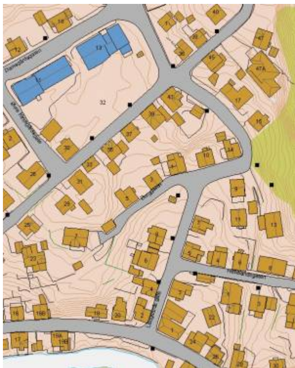
Kart: Eigersund kommunes kartløsning

Sidegate til Langaards gate som fikk sitt navn i 1905. Reguleringskommisjonens forslag til navn var Vestre Berggade , men det ble endret av formannskapet.