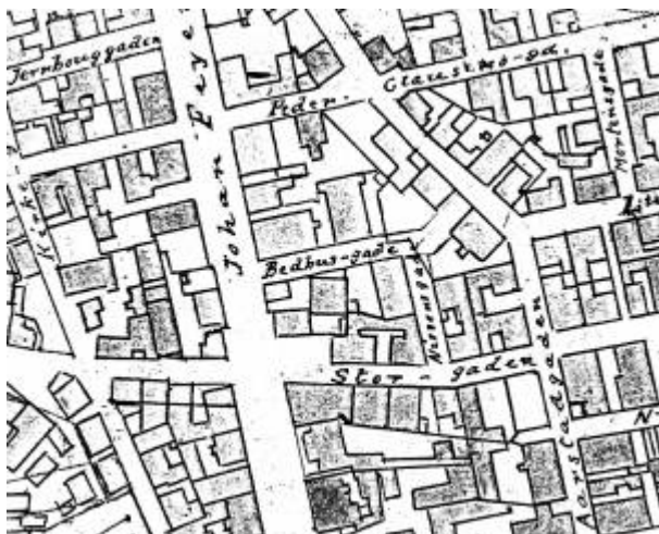
Bedehusgaten. Utsnitt av Reguleringsplan 1905.