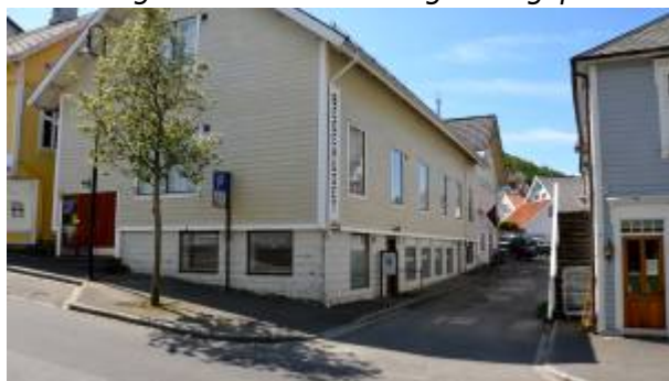
Sett fra Johan Feyers gate.

Gate mellom Johan Feyers gate og Mads Nissens gate , vist på Reguleringsplan 1858 der den er kalt Gade No.6. Gata ble opparbeidet og utbygd etter denne planen, og videreført i Reguleringsplan 1905 . I begge planene var gata ført fram til Aarstadgaten , men strekningen mellom Mads Nissens gate og denne ble ikke anlagt.