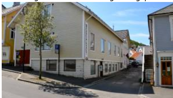
Sett fra Johan Feyers gate.

Gate mellom Johan Feyers gate og Mads Nissens gate , vist på Reguleringsplan 1858 der den er kalt Gade No.6. Gata ble opparbeidet og utbygd etter denne planen, og videreført i Reguleringsplan 1905 . I begge planene var gata ført fram til Aarstadgaten , men strekningen mellom Mads Nissens gate og denne ble ikke anlagt.