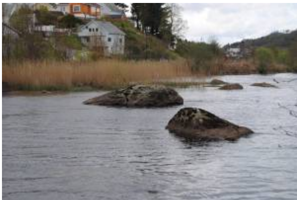
Stupesteinen i Lundeåne bakerst i bildet.

Så snart sommeren hadde kommet til byen meldte behovet for bading seg blant ungene. På 1900-tallet var mulighetene noe begrenset. Vågen og Bukte var forurenset og ikke egnet for bading. Under Varberg lå Sjøbadet i Solkrone , og senere Sjøbadet ved Fjellparken , men disse kostet det penger å bruke og de hadde regulerte badetider.