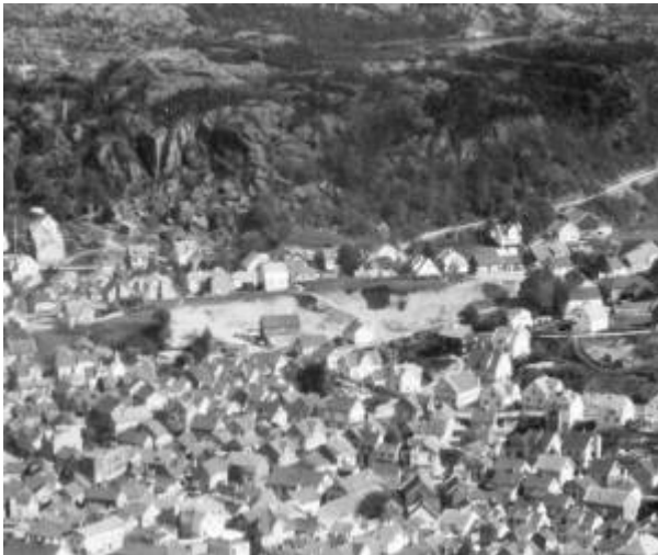
Aurgrua på Årstad.

Gammelt grustak som lå i forlengelsen av Aarstadgaten , helt ved bygrensa. Området ble utbygd med 15 bolighus på slutten av 1930-åra. Det var da det siste større tomtearealet som var tilgjengelig innenfor bygrensa. 1) 2)