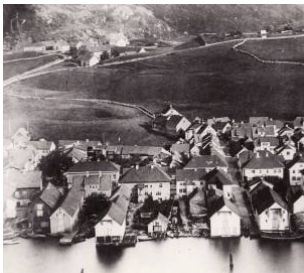
Aarstadgaten og Årstadræget. Gården Årstad øverst i venstre hjørne. Ca. 1890.