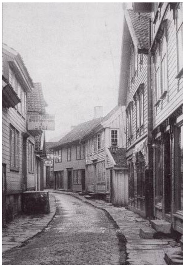
I 1880-åra lå arresten i kjelleren i andre huset på høyre hånd (Storgaten 32).

I 1880-åra var byens fengsel i kjelleren i Storgaten 32. Arrestforvalter og skomaker Ammund Haaland bodde ovenpå. I de tider brukte kommunen 160 kr årlig på drift av arresten. Senere ble arrestlokalet flyttet til Nygaten 9. 1)