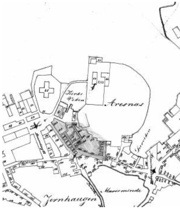
Utsnitt av et bykart fra 1868