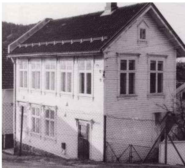
Årstadgaten 22.

Årstadgaten 22 . Arbeiderpartiet kjøpte bygningen sammen med Losse- og lastearbeiderforeningen av menigheten Samfundet i 1932. Bygningen hadde fram til 1924 tjent som skolebygning for menighetens almueskole og lærerskole. I en periode etter krigen fungerte den som skolebygning for folkeskolen da det ikke var nok plass til de store elevkullene i Folkeskolebygningen ved Parken . Bygningen eies og brukes fortsatt av Arbeiderpartiet. 1)