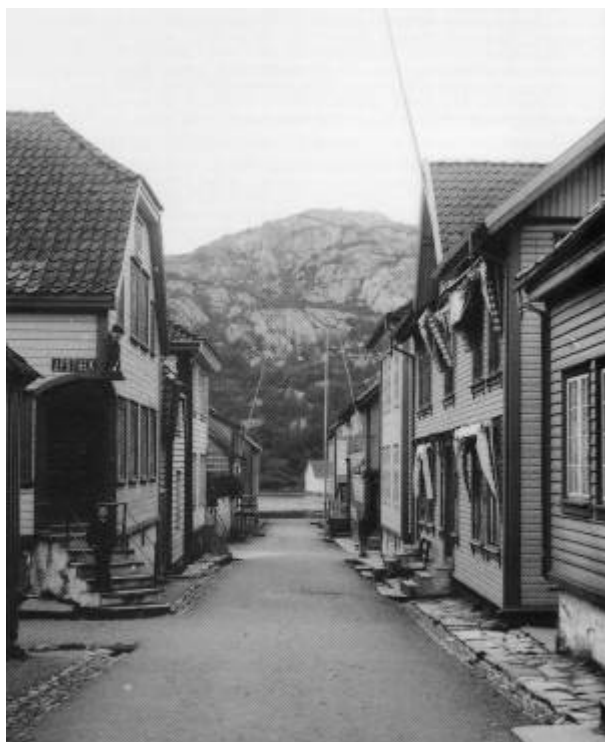
Apoteket i Nygaten 1 til venstre, sett fra Aarstadgaten.